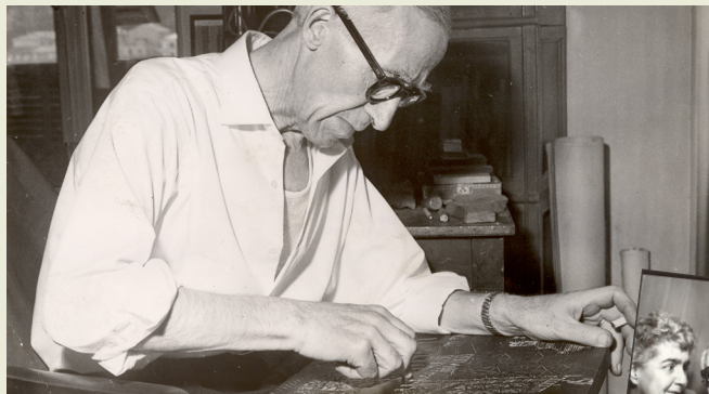
Frans Masereel in zijn atelier in Nice in 1959