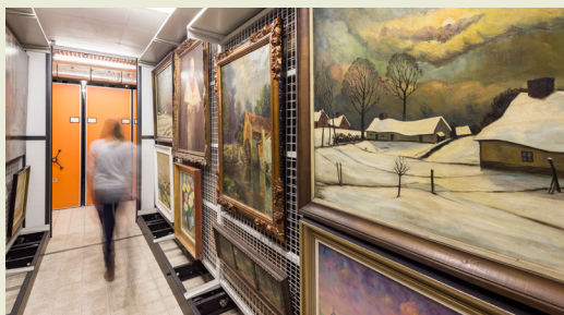
Het kunstdepot in het provinciehuis

Hoe kies je stukken uit een gevarieerde collectie van meer dan 2000 kunstvoorwerpen? Voor de drie expo's gingen honderden werken door de handen van de twee curatoren. Zo ontdekten ze de waarde van de verschillende kunstenaarslegaten in de collectie. Niet in het minst dat van Frans Masereel. Vijftig jaar na zijn dood staat zijn