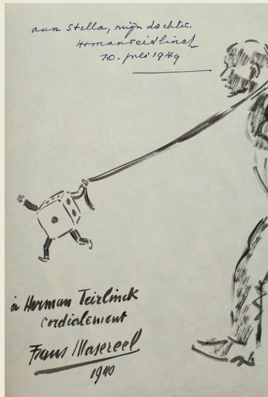
Titelpagina van 'Tooneel', privécollectie, 1940