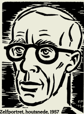
Zelfportret, houtsnede, 1957

Frans Masereel was een creatieve duizendpoot. Hij maakte tekeningen, aquarellen, schilderijen, theaterdecors en mozaïeken, maar bovenal houtsneden. De gravures sur bois noemde hij de meest 'eerlijke kunstvorm'.