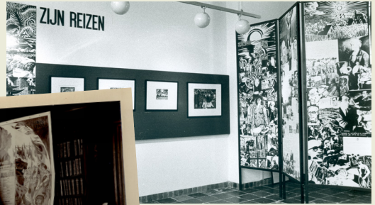
Kunst in het gouvernementsgebouw (links) — De Masereeltentoonstelling in het Openluchtmuseum Bokrijk (rechts)