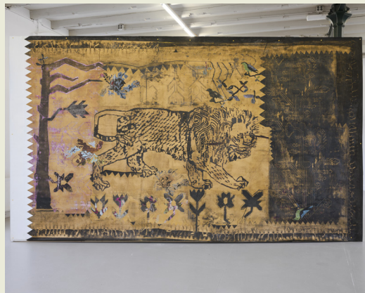
Arslan, houtsnede op papier, kunstcollectie Vlaams Parlement, 2022

“ Op een tocht door Oost-Turkije ontdekte ik een geweven tapijt met de beeltenis van een leeuw. Het vreemde en zeldzame motief trok me zo sterk aan dat ik meteen op zoek ging naar het dorp waar ambachtslieden het tapijt ooit vervaardigden. Wat bleek? Het leeuwmotief was al lang niet meer in productie, maar de patronen bestonden nog steeds. De technische tekeningen werden het vertrekpunt voor Arslan. De gelaagdheid van de verschillende drukgangen staat symbool voor de gelaagdheid van grenzen. Want onder elke grens gaan oudere grenzen en beschavingen schuil.