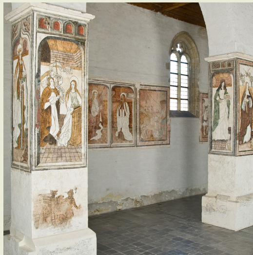
Muurschilderingen uit begin zestiende eeuw

De muurschilderingen van begin zestiende eeuw tonen veelal gebeurtenissen uit het leven van Maria en andere vrouwelijke heiligen die de begijnen tot hun eenvoudige levenswijze inspireerden. Hier duikt plots een totaal andere kunsttechniek op: blokboeken en prenten op basis van houtsneden. De stijl is sober met een witte achtergrond en vlakke voorstellingen in krachtige en opvallend hoekige omtreklijnen. Ondanks het spaarzame gebruik van kostbare blauw- en groenpigmenten is het kleurenpalet al een stuk uitgebreider.