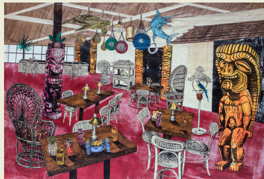
TIKI, collage van houtsnede en monotype op doek, 2016

“ Het amalgaam collectibles komt niet voort uit de verwondering of kennisdrang van de imaginair bewoner, maar simpelweg uit zijn persoonlijk verlangen om zich belangrijk te voelen.