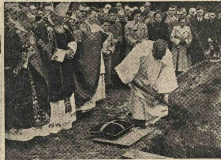
Lekebroeders dichten de grafkuil, terwijl de leden van het convent de uitvaartpsalmen zingen.

Op het hoogkoor begonnen de leden van het convent in witte