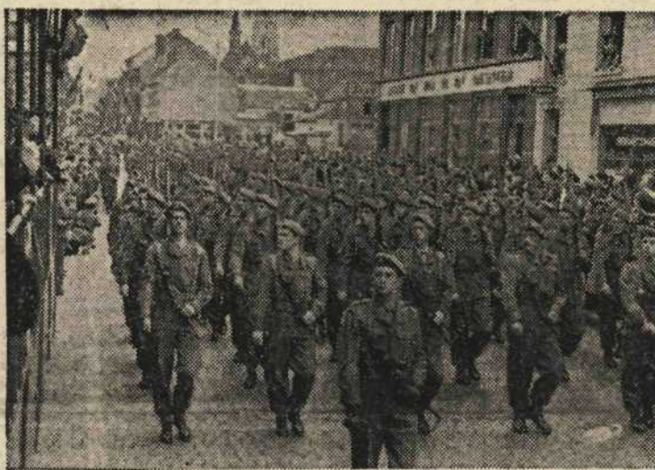
Duizenden ogen waren vol bewondering gericht op de troepen, die in perfecte marsorde defileerden door de Ambiorixstad.

Voor de Maastrichterstraat bood een indrukwekkend schouwspel, haast overbrugd door honderden driekleurige vlaggen van weerszijden aan lange masten schuin van de huizegevels hingen in de windstille ochtend.