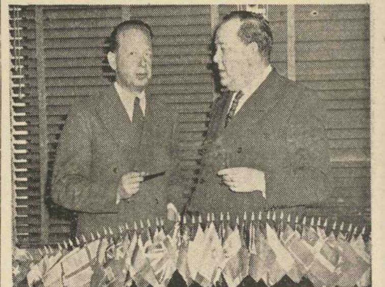
Dag Hammarskjold (links) nam de zetel van Trygve Lie over als secretaris-generaal van de U.N.O. - Hierboven ziet men beiden alvorens Hammarskjold voor de eerste maal de Algemene Vergadering voorzat.