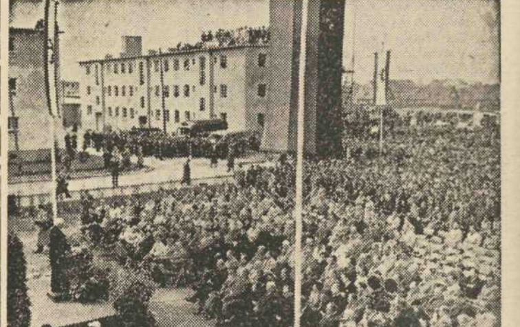
Op dit ogenblik vertoefde de West-Duitse president, Dr. Theodoor Heuss te Berlijn. Hij hield er een toespraak voor een geweldige menigte en opende er een kamp voor Oost-Duitse vluchtelingen.