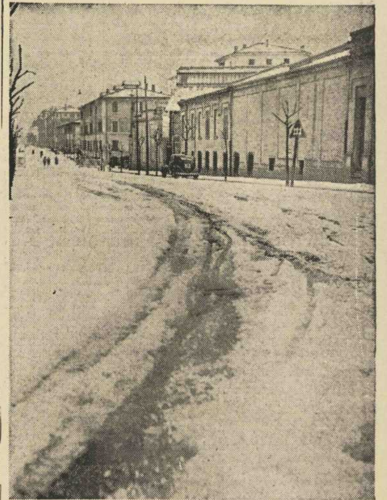
Te Bologna (Italië) en zelfs te Capri woedde zo'n hevige hagelstorm, dat na afloop van het tempeest, de steden een echt winters beeld voorstelden. Deze straat te Bologna schijnt bedekt met een dikke sneeuwlaag.