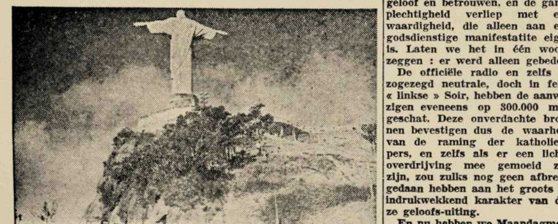
Van boven op de Monte Corvado beheerst een dertig meter hoog H. Hartbeeld de heerlijke baai van Rio de Janeiro.

Dat vast te stellen na de Mariale betoging door de niet-katholieke pers, is een eerlijke plicht.