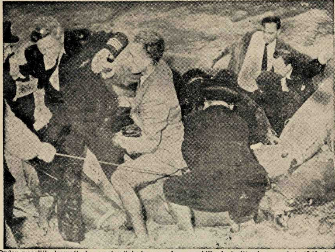
Onder waarbij dramatische omstandigheden werden verschillende inzittenden van het R.M.-vliegtuig, dat Zondag in de Shannon-rivier in Ierland neerstortte, gered. We zien hier een rubberboot, die op de modderige oever wordt getrokken. Men helpt hier de gezagvoerder van het vliegtuig uit het bootje.

Maandag begon het onderzoek naar de oorzaak van de ramp met de < Super-Constellation > van de K. L. M. « Triton ». Drie kwesties moeten in het rechte worden getrokken: