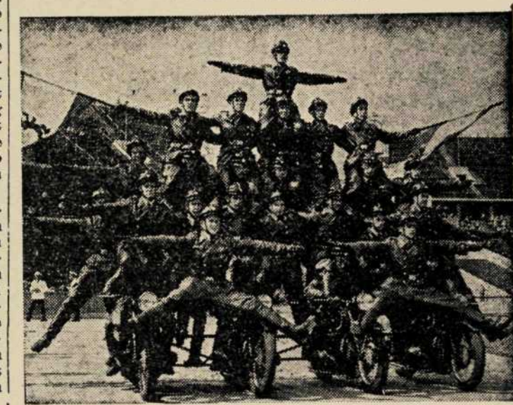
De West-Berlijnse politie houdt hier algemene herhaling, met het oog op een grootse manifestatie in het stadion. Zij geven hier een voorbeeld van behendigheid, door met 27 man op slechts 4 moto's te rijden.