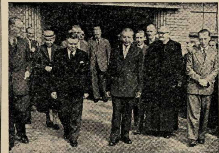
Dhr Gouverneur, samen met enkele personaliteiten, bij het verlaten van de vergaderzaal.

Officieel geopend in Aanwezigheid van Gouverneur Roppe en talrijke Personaliteiten